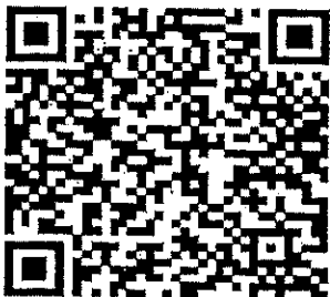
QR Code วิธีการลงทะเบียน และการรับสมัคร